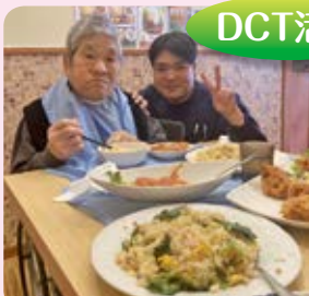
お腹いっぱい食べました!