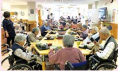
以前入居者さんと作った切り干し大根を具材にし、寄せ鍋をしました。皆さんで温かいお鍋を囲み、とっても家庭的なつつじでした。