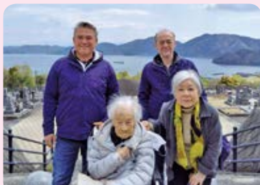
ご家族揃ってお墓参りへ